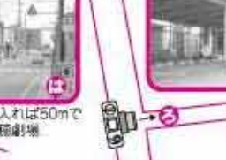
歌人 白蓮想 伝右衛門と白蓮の資料を常設展示