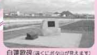
白蓮歌碑(遠くにボタ山が見えます)