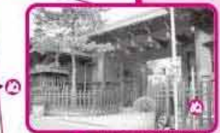
伝右衛門邸への入口(右側家屋二階壁に 富士の巻狩りのコテ絵)