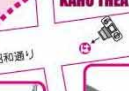
歌人 白蓮想 伝右衛門と白蓮の資料を常設展示