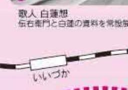
歌人 白蓮想 伝右衛門と白蓮の資料を常設展示