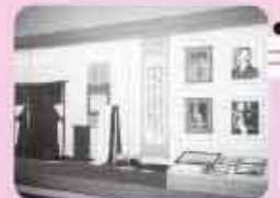
白蓮・伝右衛門の資料を常設展示